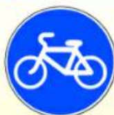
4.4.1. «Велосипедная дорожка»