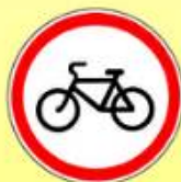
3.9. «Движение на велосипедах запрещено»