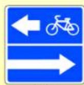
5.13.3. «Выезд на дорогу с полосой для велосипедистов»