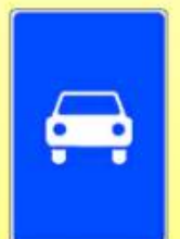
5.3. «Дорога для автомобилей»