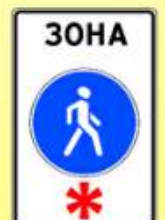
5.33. «Пешеходная зона»