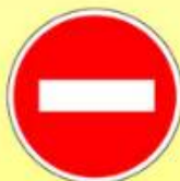
3.1. «Въезд запрещён»