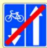
5.12.2. «Конец дороги с полосой для велосипедистов»