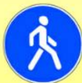
4.5.1. «Пешеходная дорожка»