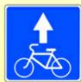
5.14.2. «Полоса для велосипедистов»