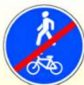
4.5.3. «Конец пешеходной и велосипедной дорожки с совмещенным движением»