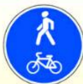
4.5.2. «Пешеходная и велосипедная дорожка с совмещенным движением (велопешеходная дорожка с совмещенным движением)»