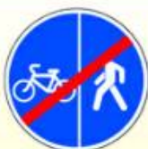
4.5.6. «Конец пешеходной и велосипедной дорожки с разделением движения (конец велопешеходной дорожки с разделением движения)»