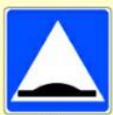
5.20. «Искусственная неровность»