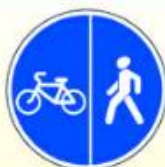
4.5.4. «Пешеходная и велосипедная дорожки с разделением движения»