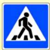
5.19.1. «Пешеходный переход»