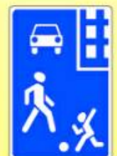
5.21. «Жилая зона»