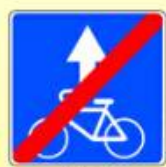
5.14.3. «Конец полосы для велосипедистов»