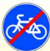
4.4.2. «Конец велосипедной дорожки или полосы для велосипедистов»