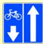
5.11.2. «Дорога с полосой для велосипедистов»