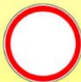
3.2. «Движение запрещено»